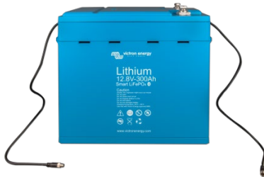
Batterie LiFePO4 12,8 V 300 Ah

Fonction très utile pour localiser un (éventuel) problème, comme un déséquilibre sur les cellules par exemple.