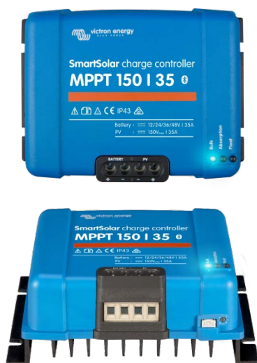
Contrôleur de charge SmartSolar MPPT 150/35