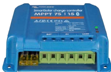
Contrôleur de charge SmartSolar MPPT 75/15