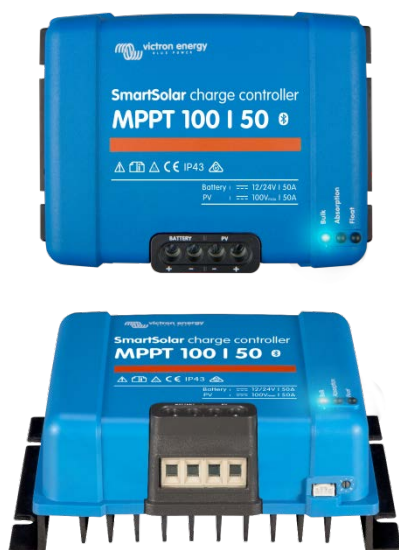
Contrôleur de charge SmartSolar MPPT 100/50